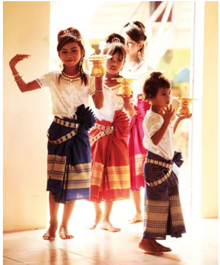
Per la protezione dei diritti dell'infanzia

di fiducia con le persone coinvolte. Inoltre ECPAT è in grado di attivare una rete di almeno 35 ONG su tutto il territorio nazionale per una raccolta dati regolata da una metodologia comune. Sulla base dei risultati degli anni passati il database di ECPAT è stato riconosciuto dal Governo come uno degli strumenti più affidabili per l'analisi della tratta a scopo di sfruttamento sessuale e i dati raccolti vengono integrati nel "National Information Reporting System".